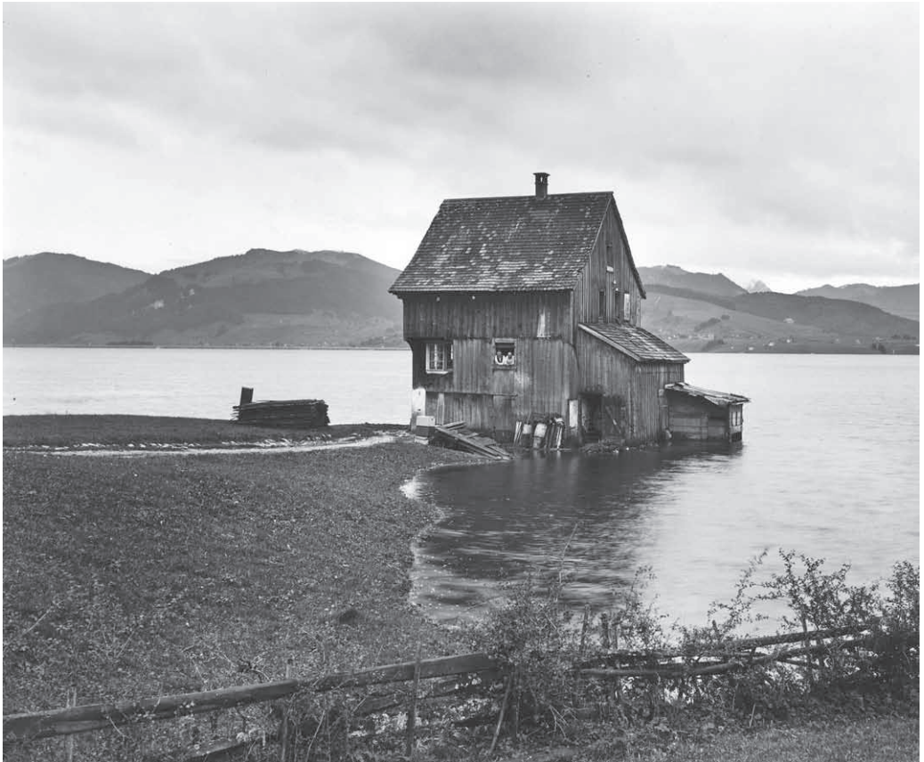
Ein Haus in Willerzell, das langsam überflutet wird.

auch jetzt tauchen in den Aussenstellen wie im Kloster Fahr oder der Propstei St. Gerold immer mal wieder Schachteln oder Alben mit Fotoabzügen, Dias und Negativen auf, die ebenfalls ins Fotoarchiv gehören.