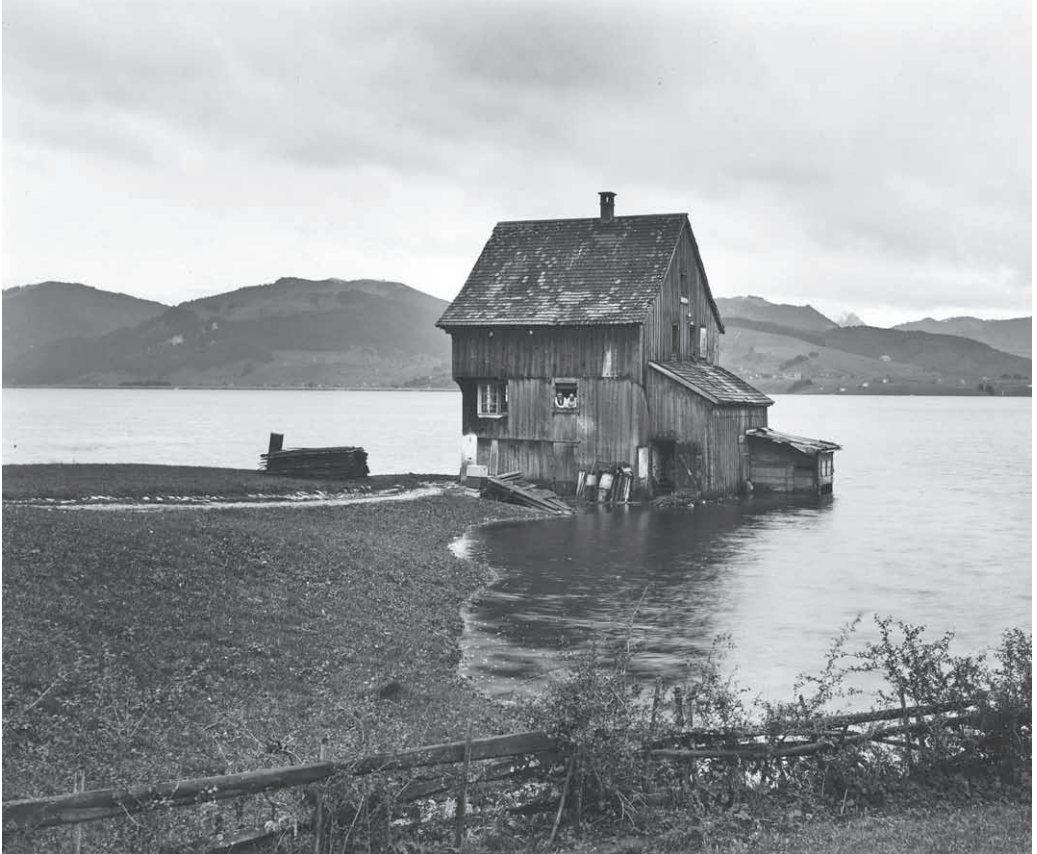
Ein Haus in Willerzell, das langsam überflutet wird.

auch jetzt tauchen in den Aussenstellen wie im Kloster Fahr oder der Propstei St. Gerold immer mal wieder Schachteln oder Alben mit Fotoabzügen, Dias und Negativen auf, die ebenfalls ins Fotoarchiv gehören.