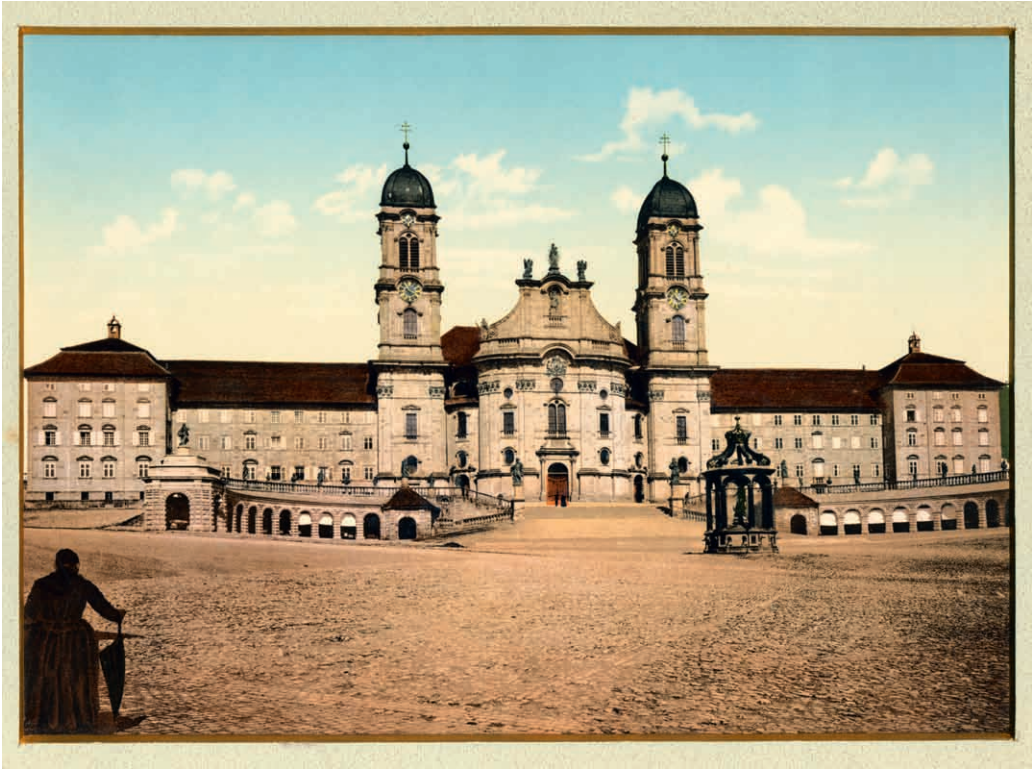
Auf diesem Autochrom von ca. 1910 haben die meisten Fenster an der Klosterfassade eindeutig keine Läden.

Besuchern aus dem fernen Amerika, so zum Beispiel als ein Mönch aus St. Meinrad zu Besuch in Einsiedeln war und nach historischen Abbildungen von dem amerikanischen Tochterkloster suchte.