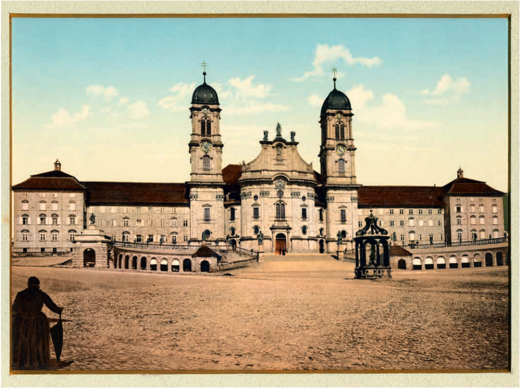
Auf diesem Autochrom von ca. 1910 haben die meisten Fenster an der Klosterfassade eindeutig keine Läden.

Besuchern aus dem fernen Amerika, so zum Beispiel als ein Mönch aus St. Meinrad zu Besuch in Einsiedeln war und nach historischen Abbildungen von dem amerikanischen Tochterkloster suchte.