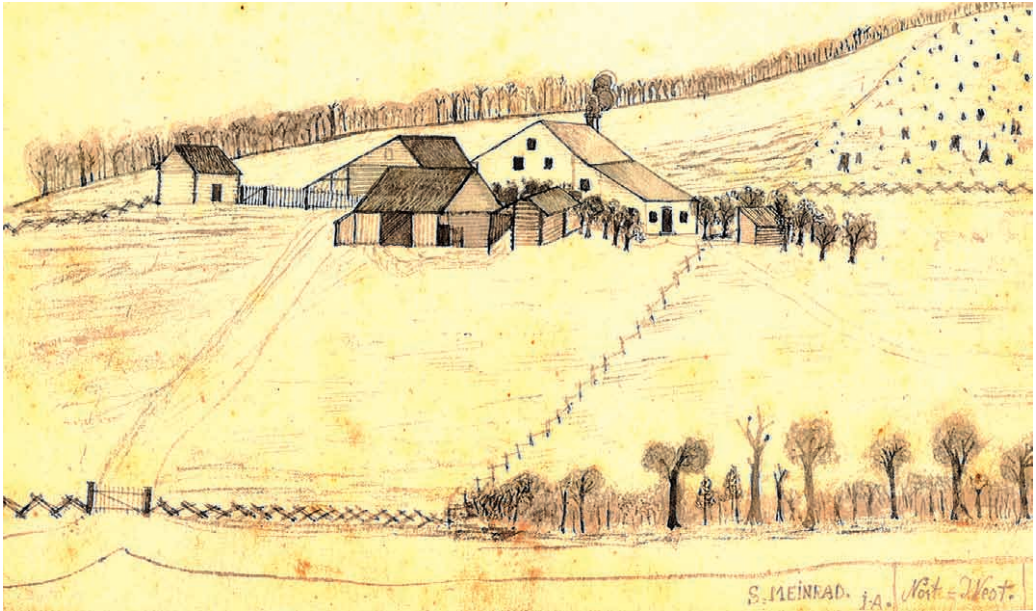
Die Abtei St. Meinrad in Indiana (USA).