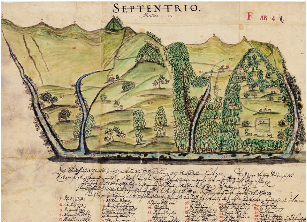
Die Propstei St. Gerold in Vorarlberg (A) (KAE, Plan 2.0001.0017).