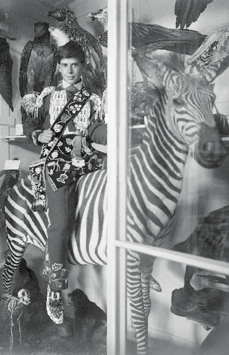
Junger Reiter auf dem Zebra im Naturienkabinett. Das Zebra existiert heute nicht mehr. Undatiert, ca. 1930. KAE, Glasplatte 05212.