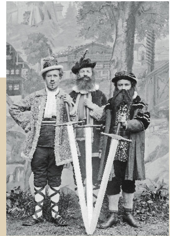
Darsteller der Schulooper Wilhelm Tell von Rossini. Undatiert, 1883. KAE, Glasplatte 02371.

Die Originale der gezeigten Bilder sind Glasplattenegative. Glas wurde seit den 1850er Jahren bis zur Mitte des 20. Jahrhunderts häufig als Träger für Fotonegative verwendet. Im Rahmen der Reorganisation des Klosterarchivs (2005 bis 2012) wurde der Glasplattenbestand des Klosters am Imaging & Media Lab der Universität Basel digitalisiert und auf dem Internet zugänglich gemacht ( www.klosterarchiv.ch ). Die präsentierte Auswahl der Bilder wurde digital nachbearbeitet, als Laserfoto aus belichtet und auf Alu-Dibond-Platten aufgezogen.