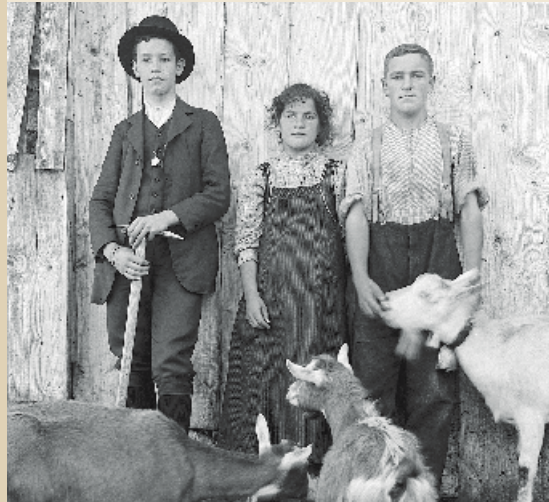
Junge Ziegenhirten in der Region Einsiedeln. Undatiert, ca. 1930. Glasplatte 05355.

Die Originale der gezeigten Bilder sind Glasplattenegative. Glas wurde seit den 1850er Jahren bis zur Mitte des 20. Jahrhunderts häufig als Träger für Fotonegative verwendet. Im Rahmen der Reorganisation des Klosterarchivs (2005 bis 2012) wurde der Glasplattenbestand des Klosters am Imaging & Media Lab der Universität Basel digitalisiert und auf dem Internet zugänglich gemacht ( www.klosterarchiv.ch ). Die präsentierte Auswahl der Bilder wurde digital nachbearbeitet, als Laserfoto aus belichtet und auf Alu-Dibond-Platten aufgezogen.