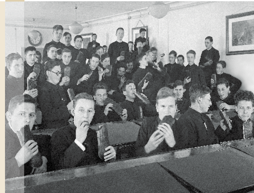
Bild Titelseite: Stiftsschüler mit Bireweggen zum Chlaustag. Undatiert, ca. 1920. KAE, Glasplatte 04886.

Klosterarchiv Einsiedeln CH-8840 Einsiedeln www.klosterarchiv.ch archivar@klosterarchiv.ch