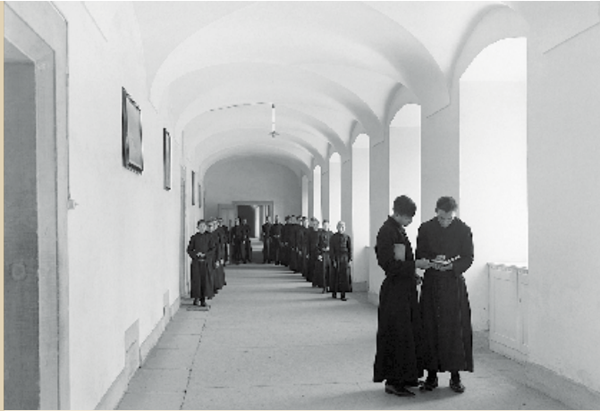
Studenten beim Studium im Gang der Stiftsschule. Undatiert, ca. 1930. KAE, Glasplatte 00862.

Der untere Gang der Stiftsschule präsentiert sich von einer neuen und doch altbekannten Seite. Frühe Fotografien vom Alltag der Schüler dokumentieren das Leben an der Einsiedler Stiftsschule im späten 19. und frühen 20. Jahrhundert. Die Bildthemen reichen von Unterricht und Studium über Musik und Theater bis hin zu Sport und Freizeit. Die Bilder der jungen Küchenmannschaft oder der Ziegenhirten geben ausserdem Einblick in andere, weniger privilegierte, jugendliche Lebenswelten.